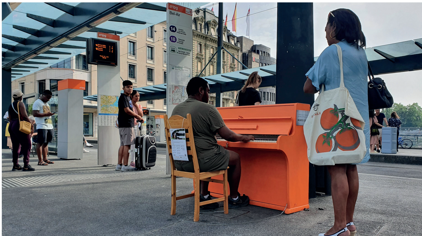
A Bel-Air, le piano en libre-service est très visité, joué et écouté. Piano peint en orange à l'occasion du sponsoring Migros.

Les pianos représentent un moyen simple et original d'amener des moments d'animation, de culture et d'échange dans l'espace public. Ils permettent de redécouvrir sa ville et d'apprécier, le temps d'une chanson ou plus, la beauté de notre canton.