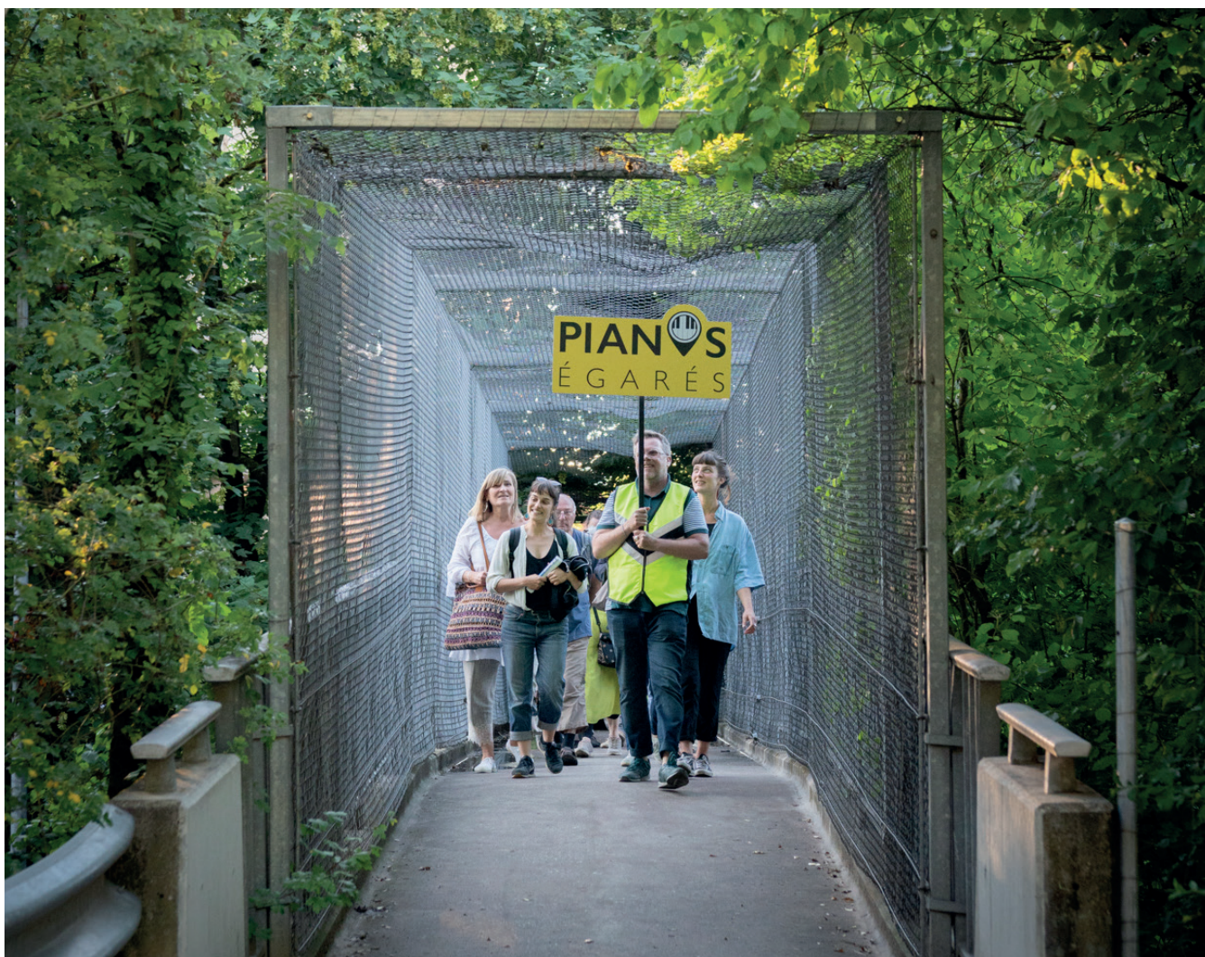
Le public est acheminé à pied jusqu'au lieu de concert : une expérience différente du concert traditionnel, à la (re)découverte de l'espace public.

En milieu urbain, il faut souvent savoir compter avec le bruit environnant. Ceci n'a jamais réellement dérangé les concerts, mais a peut-être ajouté une touche de poésie et d'insolite à ces moments musicaux qui s'approprient l'espace public.