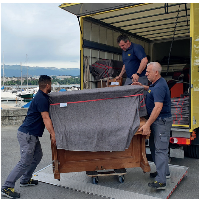
L'entreprise Blein en action

Chaque piano est équipé d'un cadenas sur le couvercle, afin de pouvoir le fermer la nuit. Ce sont les coursiers à vélo de La Vélopostale qui ont assuré l'ouverture et la fermeture des pianos sur toute la durée de l'événement.