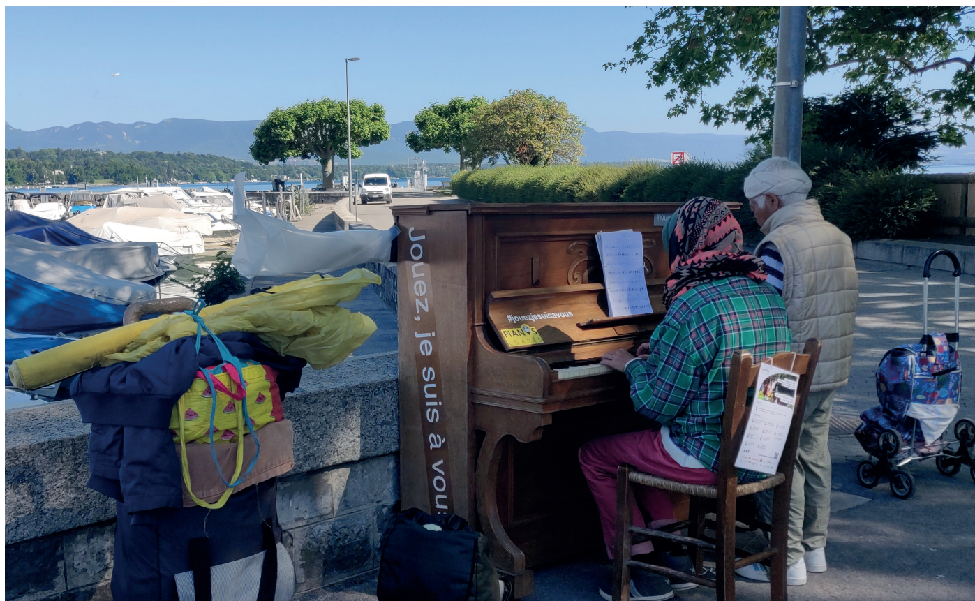
Le public des pianos en libre-service représente une grande mixité socio-culturelle.

L'objectif est à la fois social et culturel : les Pianos égarés favorisent la promotion de la musique et sont un vecteur de cohésion sociale.