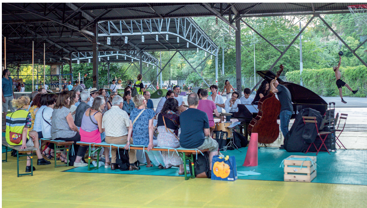
Concert au coeur de l'espace de sports Asphalté, à la Jonction.