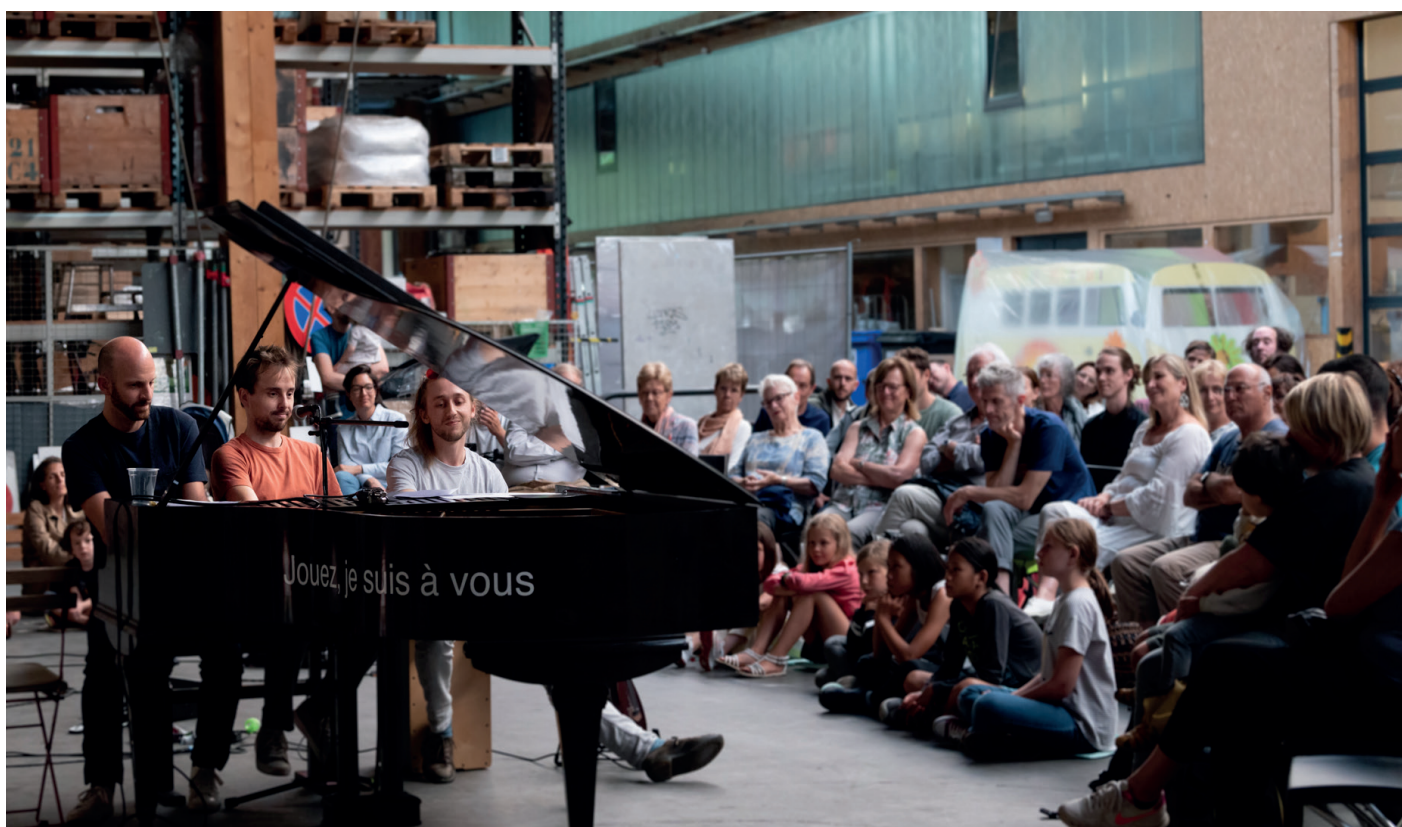
Un grand succès pour le concert de Hector ou rien, dans l'espace insolite de la Voirie de Carouge.

Le sentiment de se réappropriier l'espace public et de mieux vivre en ville était omniprésent à travers ces 18 jours -- un objectif qui est au coeur des activités de l'association Tako.