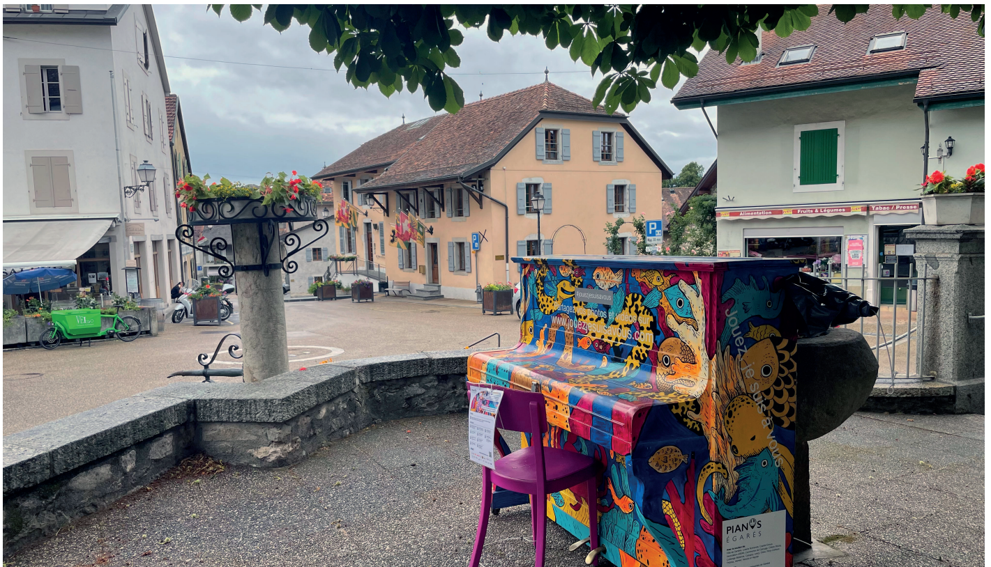
Le piano en libre-service sur la place de l'Eglise au coeur de Veyrier.